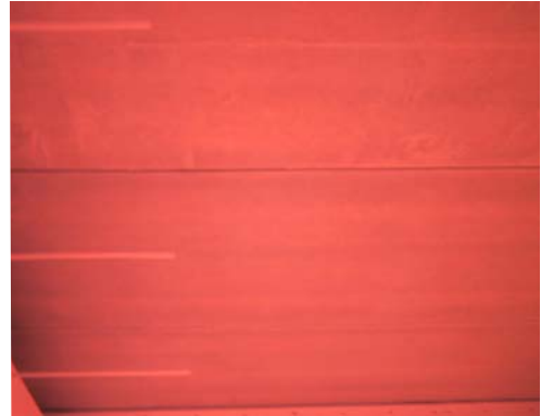
. . . . medens der i ovnen under dækket bliver 900-1000 °C varmt

De to første forsøg forløb uden der på noget tidspunkt indtrådte brud, afskalninger eller andre væsentlige skader på huldækkene. Hverken i det én time lange brandforløb eller i den efterfølgende afkølingsfase på ca. 1½ time.