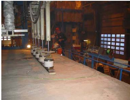
5 hydrauliske presser belaster dækket med sammenlagt 16 ton i testzonen

Der er i begyndelse af april gennemført 3 forsøg på Sveriges Provnings- och Forskningsinstitut (SP) i Borås. Forsøgene blev udført med forskellig belastning, svarende til en udnyttelse på henholdsvis 65%, 75% og 80% af den deklarerede regningsmæssige styrke af dækkene i kold tilstand. Dette er meget høje lastniveauer for et brandtilfælde, hvor lasten typisk kan regnes at være noget lavere, end hvad der kræves ved designet i kold tilstand.